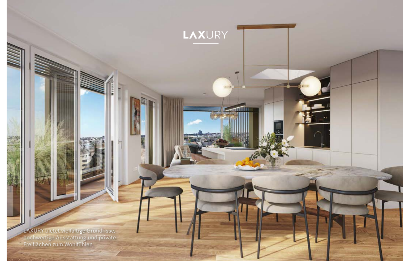
LAXURY bietet vielfältige Grundrisse, hochwertige Ausstattung und private Freiflächen zum Wohlfühlen.